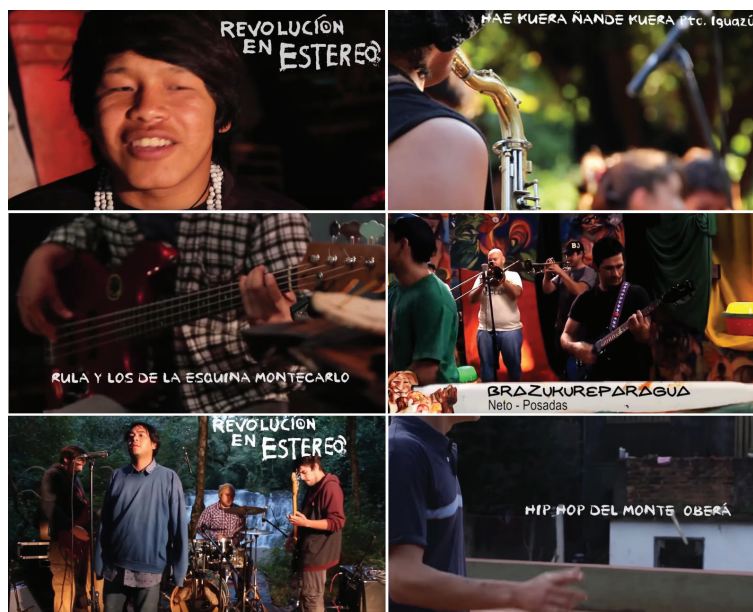
Figura 3. Escenas del programa Revolución en Estéreo , Nodo Audiovisual Misiones

Nota. Montaje elaborado por el autor con imágenes tomadas del acervo del programa.