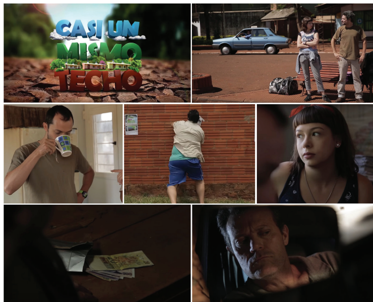
Figura 2. Escenas de la producción Casi un mismo techo , Nodo Audiovisual Misiones

Nota. Montaje elaborado por el autor con imágenes tomadas del acervo del programa.