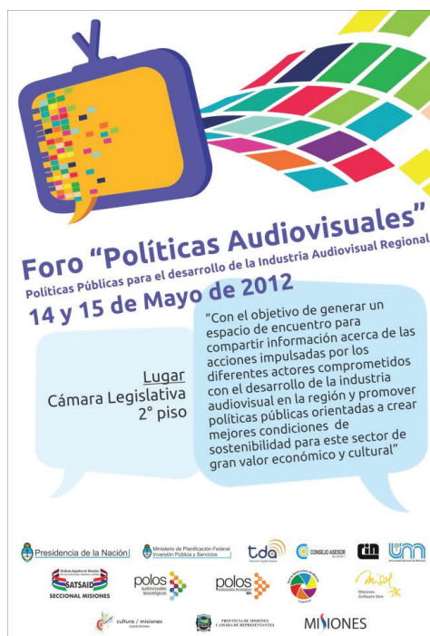
Figura 4. Difusión del primer Foro de Políticas Públicas Audiovisuales de Misiones